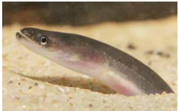
ÅLYNGLET SÖKER sig till skyddsplatser och rör sig efter föda i skymningen och på natten.