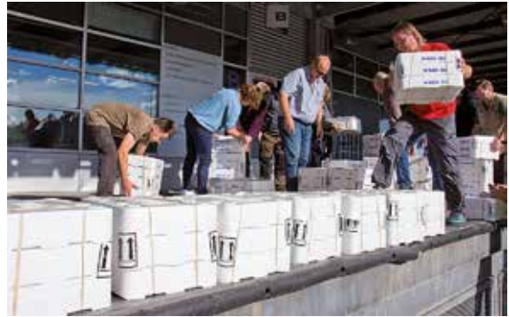
ÅLYNGLEN ANLÄNDER till Finland med flyg- eller bilfrakt. Ålarna är packade i lådor som innehåller 1 000 ålyngel var.

Ålarna kan leva i våra vatten till och med 40 år innan de når könsmognad och börjar sin 6 000 kilometer långa vandring till Sargassohavet.