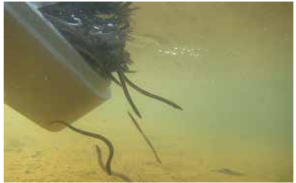
ÅLYNGLEN SÄTTS UT i vatten runt om i Finland. Utsättningen sker under sommaren.