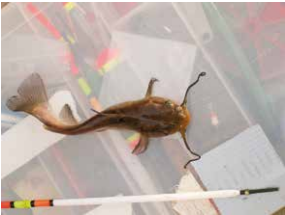
Kaikille kaloille. Fongaajan kalapakista löytyy oikeanlainen koho, koukku ja paino myös piikkimonnille.