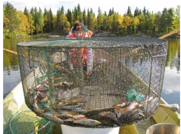
Katiskalla fongattua. Hyvällä katiskalla voi saada saaliiksi lukuisia kalalajeja niin avovedestä kuin jään alta.

Siikakin menee katiskaan. Varsinkin mateen kudun jälkeen talvella siiat tulevat ahmiimaan mateen mätiä ja menevät silloin jään alle asetettuun katiskaan.